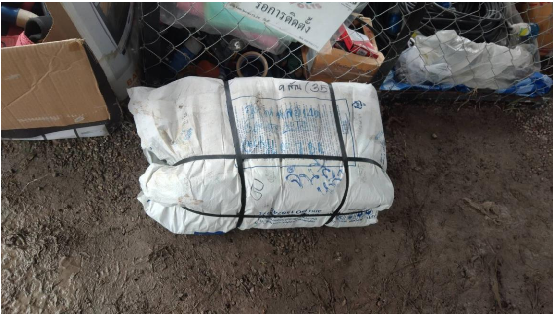
รายการเบิกของแผนก IN SU